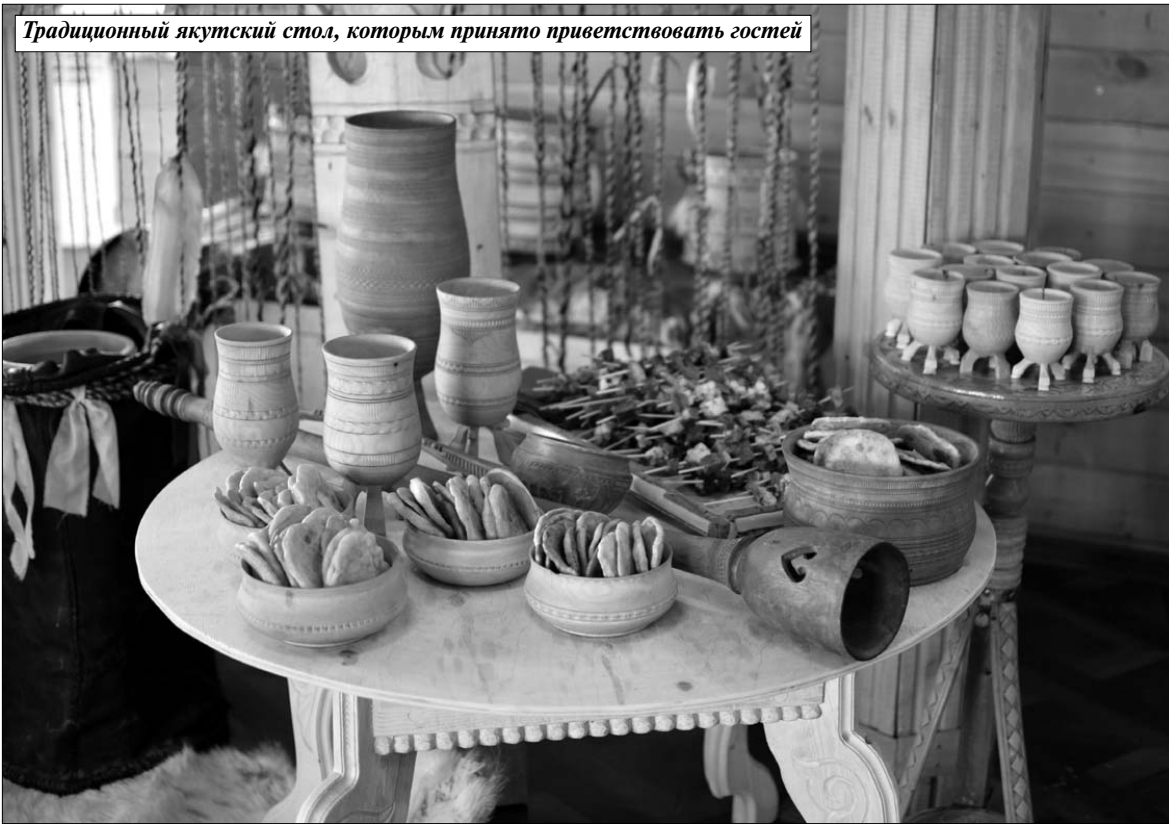
Традиционный якутский стол, которым принято приветствовать гостей