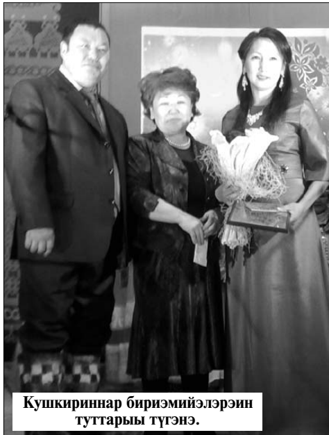
Кушкириннар бириэмийэлэрин туттары түгэнэ.