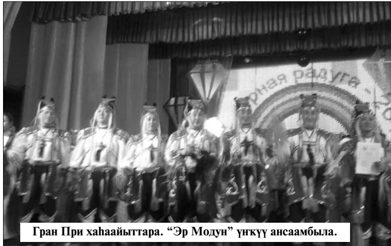
Гран При хаһаайыттар. "Эр Модун" үгкүү ансамбыла.