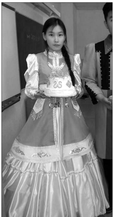
нэйтэн үөрэниэн баҕалаахтар бааллар.