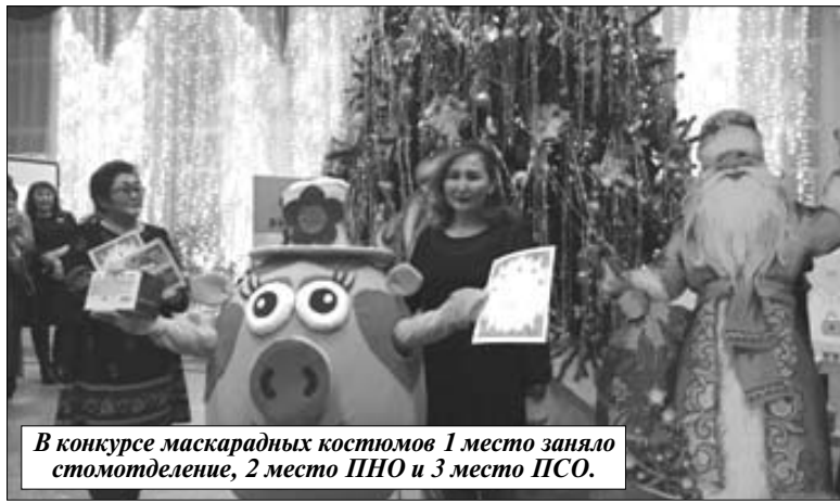
В конкурсе маскарадных костюмов 1 место заняло стоматологическое отделение, 2 место ПНО и 3 место ПСО.