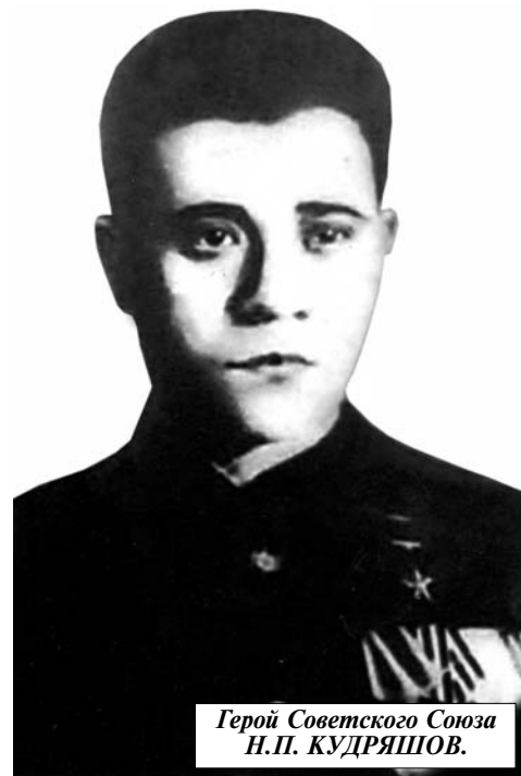
Герой Советского Союза Н.П. КУДРЯШОВ.

Указом Президента Российской Федерации от 24 октября 2013 года № 800 Кудряшов Николай Петрович восстановлен в