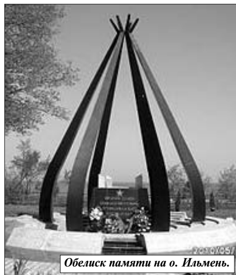
Обелиск памяти на о. Ильмень.