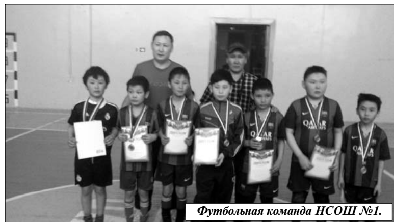
Футбольная команда НСОШ №1.