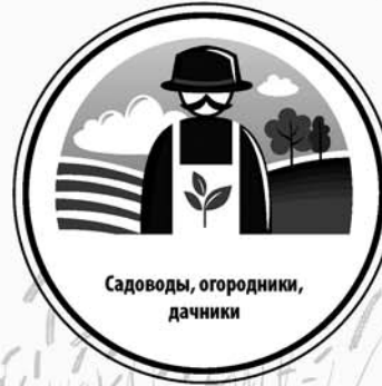
Садоводы, огородники, дачники