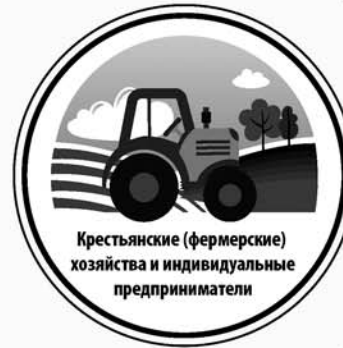
Крестьянские (фермерские) хозяйства и индивидуальные предприниматели