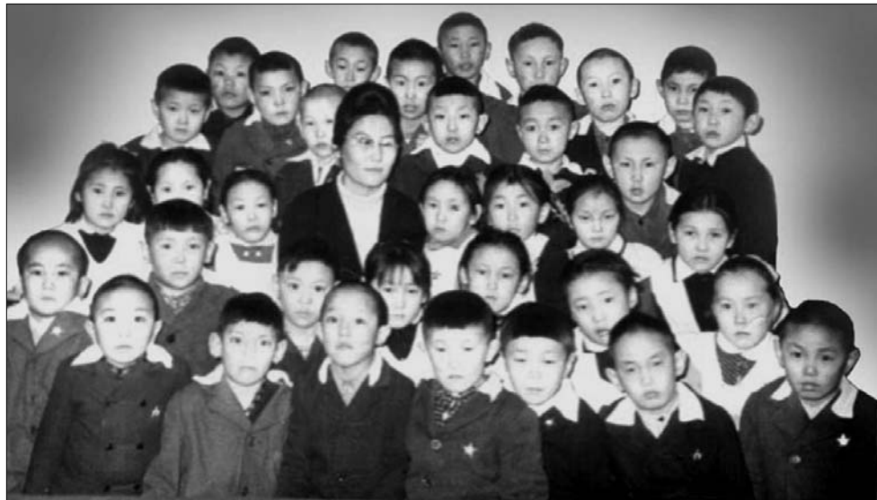
Аҕабыт алааһын курдук ахтар, Ийэбит мичээрин курдук суохтуур Билинни-көрүүнү бэлэхтээбит, Үөрэммит-иһиппит күндү Биһикпитин - Чуукаарбыт орто оскуолатын өрөгөйдөөх Үбүлүөйүнэн Итии-истиг эбэрдэбитин тизэрдэбит. Бастакы учууталларбыт эрчимнэрин инэриммит,

2015 сыл кулун тутар 27 күнүгэр Сахабыт сиригэр кэтэһиилээх сандал сааспыт тийэн кэлбит ылаангы күннэригэр суолу-иһи баттаһа, өрөспүүбүлүкэбит араас улуустарыттан, нэһиликтэриттэн, дьомлоох долгуйар Дьокуускай куораттан олох киэн аартыгар көччөх гынан көтүппүт кыһабыт 100 сыллаах өрөгөйдөөх үбүлүөйүнэн ис дууһаттан тахсар эбэрдэ тылын этээри, ааспыт ахтыһа, билингини биһирии, инникини түстүү тийэн кэлибит.