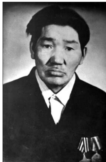
Сэрииттэн кэлэн баран 3 снл завхоһунан үлэтир. Ол кэнниттэн "Коммунизм" холкуоска снлгыһы-

"Албан аат" 3-с истиэпэннээх уордыанынан, "Бойобуой үтүөлэрин иһин", "Германияны Кыайы иһин", "50, 60 лет Вооруженных сил СССР", "За доблестный труд" у.д.а. мэтээллэринэн нафарадаламмыта.