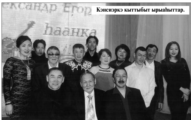
Кэнсиэркэ кыттыбыт ырыаһыттар.

Аан маннай киһи төрөөбүт Ньурбатыгар ырыа бырааһынныгыт 2011 с. "Олоҕум аргыс ырыа-