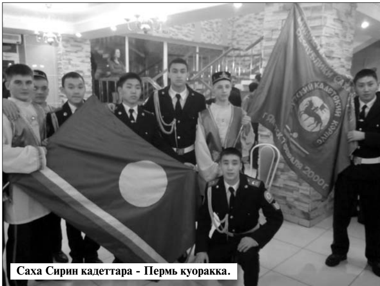
Саха Сириин кадеттара - Пермь куоракка.

татан туран физическэй бэлэмнин көрөллөр. Турникка 12-тэ тардыны, 100 м 13 сөк сүүрүү, 1 км эмиэ бириэмэбэ сүүрүү, 2 м уһуну ыстаны бааллар. Алгебраны, нуучча тылын туттарыллар, психологияга тест толорофун. Оттон араас талааннаах оҕолор кункуруһу таһынан аһаллар. Экзаменнар атырдыах ыйын сангытыгар сафаланаллар.