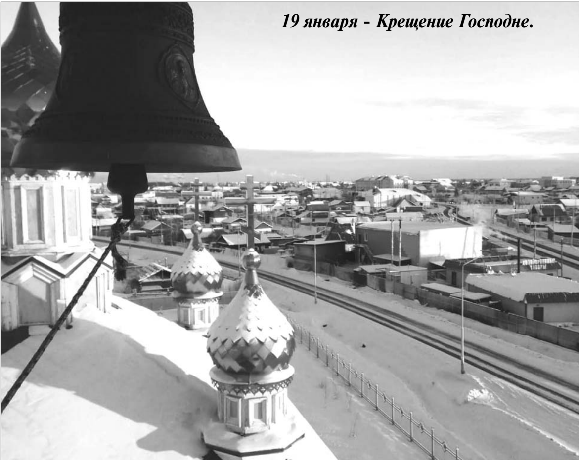
19 января - Крещение Господне.