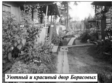
Уютный и красивый двор Борисовых

- Все зависит от тебя самого. Если ты порядочный, придерживаешься здорового образа жизни, имеешь хорошее ко всем от-