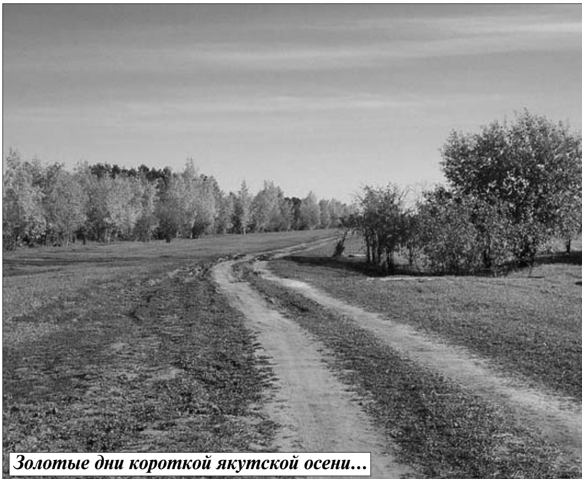
Золотые дни короткой якутской осени...