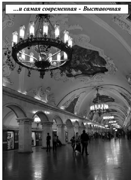
...и самая современная - Выставочная