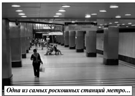
Одна из самых роскошных станций метро...

не очень магазинов и закусовых сменяются скромными табличками "Памятник архитектуры, охраняется государством", мимо сторбленных старушек, продающих маленькие букетики цветов у переходов, пронесая спортивные автомобили золотой молодежи... Здесь все живет - громко, быстро, ярко. Даже ночью город никогда не засыпает окончательно.